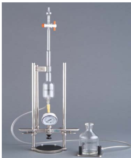
Figura 1. Analizador de CO2 y espacio de cabeza en bebidas carbonatas en lata y botella. Headspace “Air” Testers for Cans & Bottles.

El equipo de perforación asegura el tapón de la botella o la parte superior de la lata, se logra su cierre hermético mediante una junta de goma y una broca para perforar el envase, se conecta a un manómetro y una válvula de salida de gas. (Figura 1)