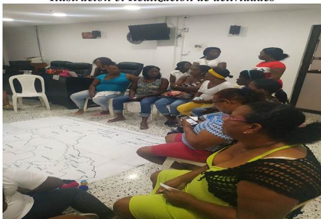
Ilustración 5. Realización de actividades

“Como experiencia es un poco complicado porque los programas que ha implementado el Distrito, son totalmente distintos a los programas desde la perspectiva que la unidad los ha propuesto” GF3_MLaComadre