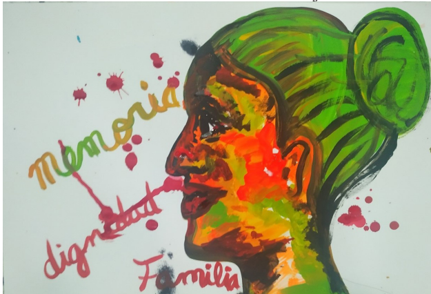
Ilustración 2. Lienzo de mujer