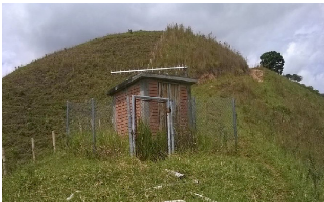
Ilustración 3. Estación Modín.

minutos aproximadamente. La caseta se encuentra protegida con una reja como se muestra en la ilustración 3, la cual evita algún daño con el paso de personas y animales del sector.