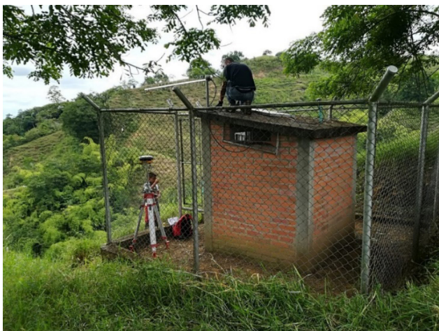
Ilustración 2. Estación Riberalta.

La estación sismológica Riberalta está ubicada en el corregimiento Riberalta del Norte del Valle del Cauca, perteneciente al municipio de La Victoria, la cual se observa en la ilustración 2. El acceso a la estación se realiza en automóvil hasta donde termina el corregimiento, luego es necesario caminar alrededor de 20 minutos para llegar hasta donde está ubicada.