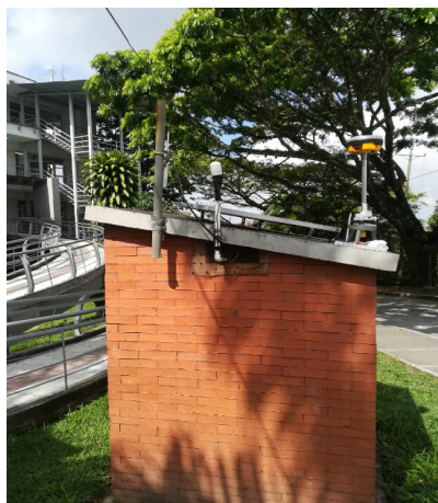
Ilustración 1. Estación UQ.

La estación sismológica Uniquindío está ubicada en el municipio de Armenia dentro de las instalaciones de la Universidad del Quindío, específicamente en la facultad de ingeniería, como se observa en la ilustración 1, contando con todos los equipos necesarios para la recopilación de información, que posteriormente es enviada al OSQ.