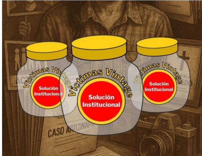
Imagen 2. Representación visual de las “Víctimas vintage” como artefacto filosófico. 4