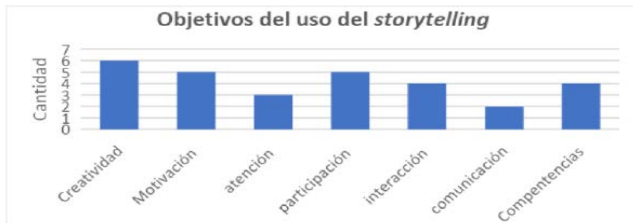
Grafica 2. Objetivo del uso del storytelling digital