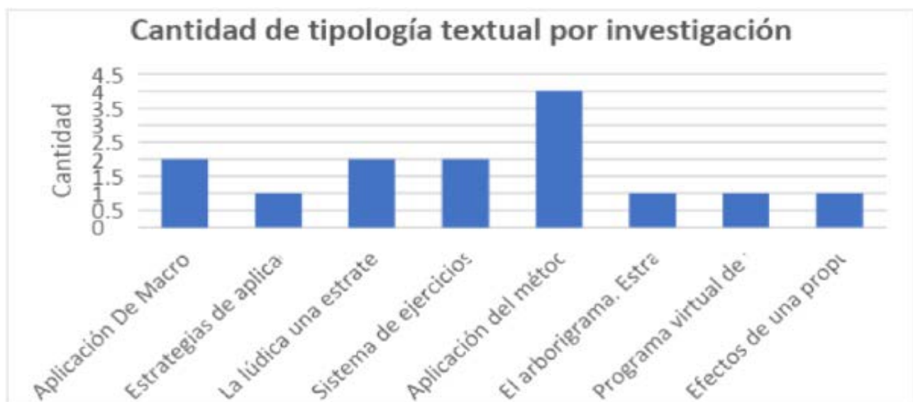
Gráfica 1. Cantidad de tipología textual por investigación